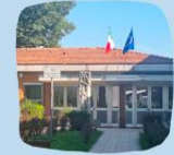
SECONDARIA 1° BINASCO