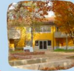
SECONDARIA 1° MONCUCCO